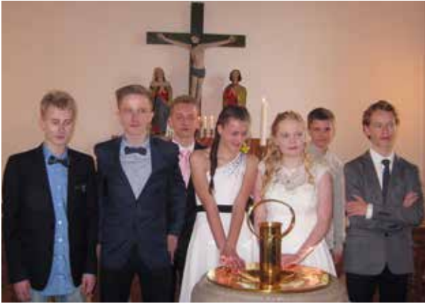
Tillykke med konfirmationen i Øster Velling Kirke den 17. april 2016.