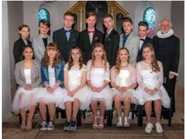
Tillykke med konfirmationen i Grensten Kirke, Bededag den 22. april 2016.